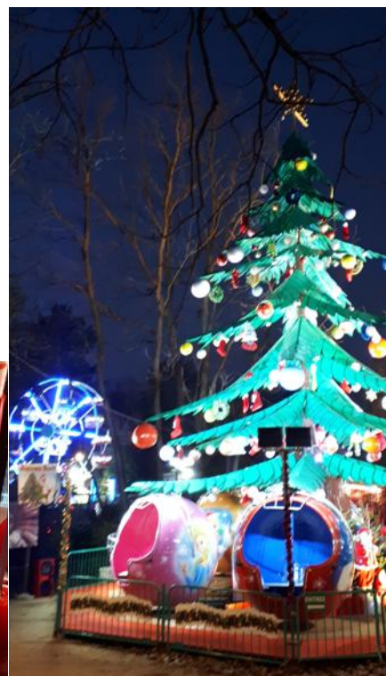
Manèges et sucreries toujours là.