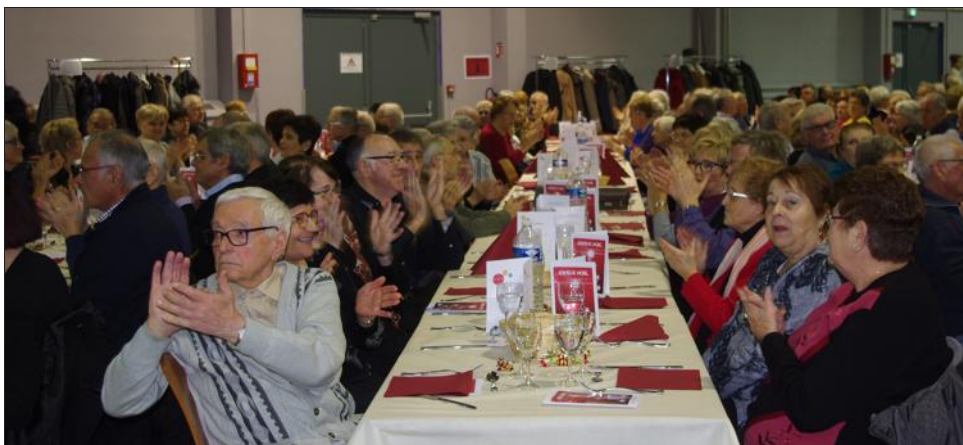
650 seniors étaient présents le vendredi.