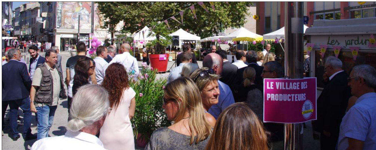
Le top départ de la Grande Braderie a été donné par le député-maire vendredi, place de l'Europe où se tenait cette année un marché des producteurs, venus de Montélimar et des villages de l'Agglo : Maubec, Marsanne, la Laupie...