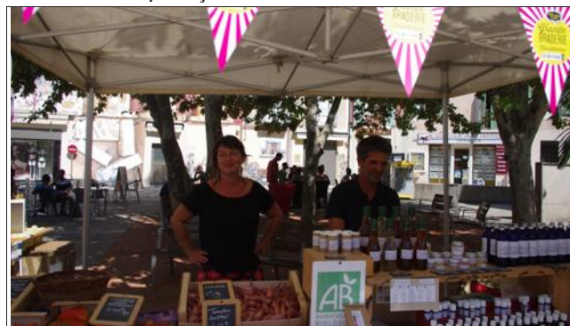
Le marché des producteurs place de l'Europe. On pouvait y trouver du miel, des huiles essentielles, du raisin, des légumes... sur notre photo, les producteurs de Saint-Gervais-Sur-Roubion Vallyherba.