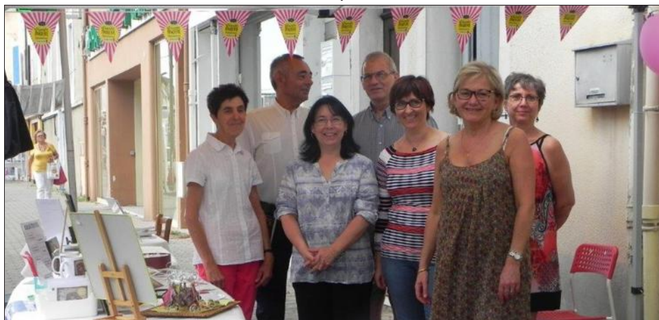
L'imprimerie du Faubourg a mis à l'honneur à l'occasion de la braderie les auteurs et créateurs locaux.