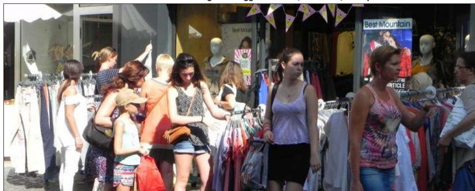
Foule dans les rues du centre-ville dès le vendredi matin. L'événement a drainé du monde dans les rues piétonnes et sur les terrasses des Allées provençales.