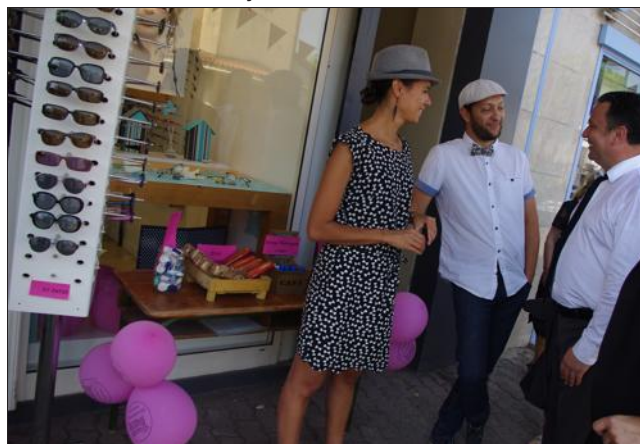
Avec cette Grande Braderie nouvelle dimension, des commerçants de Saint-James se sont lancés dans l'aventure des deux jours.